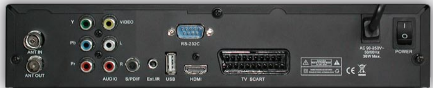
Rückansicht und Anschlüsse

Bestell-Nr. 981001-293 EAN-Nr. 9810012930001