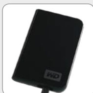
Mobile Festplatte optional 3

1 ) HD-Programme 2 ) abhängig von Videoinhalten 3 ) nicht im Lieferumfang